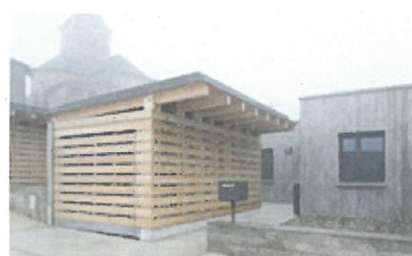
Exemple de logements communaux à Lagney